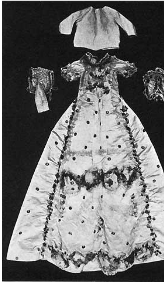
Fig. 9. Daabsdragt fra Holsteinborg.