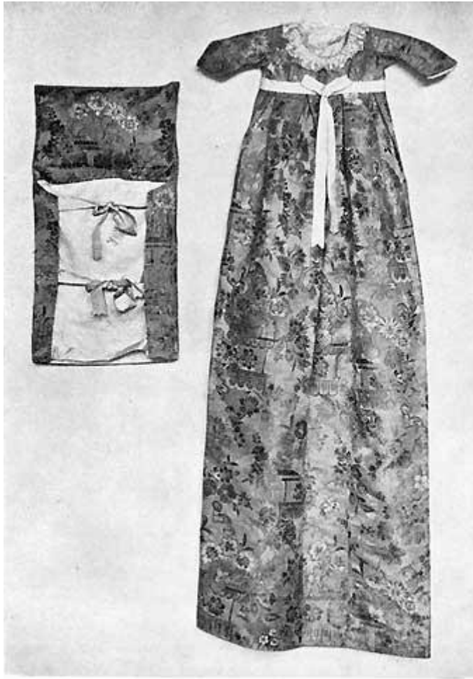
Fig. 8. Kristentøj fra Skæring Munkegaard.