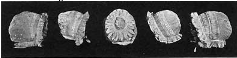
Hvide Daabshuer i »Den gamle By«.

Samtidig med Daabskjolen af det lette Materiale kom en tilsvarende Hue i Brug. Den var gerne af Linon (Moll) eller Bobinet, udstyret med fransk Broderi og med pibet Tyll eller Knipling i Kanten. »Den gamle By« har en smuk Samling af disse Huer, to af dem kan tidsfæstes til 1838 og 1843, men i Privateje her i Byen findes en Samling Daabshuer, hvis Oprindelse ligger mellem 1811 og 1865.