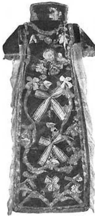
Fig. 6. Kristentøj fra Benzons.

Resultater, man oftest naaede. Forsiden af denne Kristenpose er foroven af rød, naalestribet Silke, medens den nederste Del er af brocheret Silketøj, hvis dekorative Mønster - Striberne med det slyngede, kniplingslignende Baand i graahvidt og derimellem naturalistisk farvede Strøbuketter - fremhæves smukt af den rolige, graabrune Bund. Et lignende Mønster findes paa et Stykke Silketøj af en Brudekjole fra 1772.