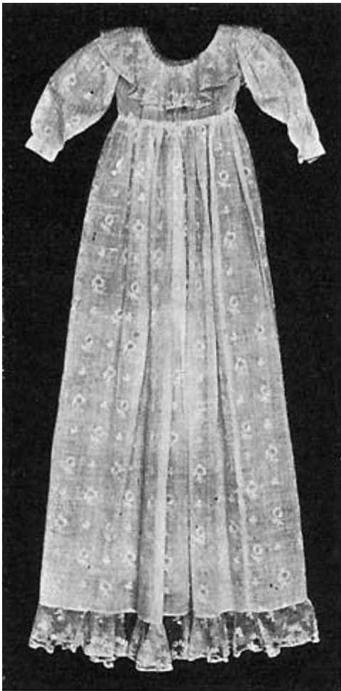
Fig. 11 a.

De to Huer, hvoraf den ene har været bestemt til Drengene og den anden til Piger, er af samme Stof som Kjolen, overtrukne med puffedede Silkekniplinger og pyntede med Tøjblomster og lyserødt mønstrede Baand. Denne Pynt er anbragt forskelligt, ligesom Snittet heller ikke er ens. Drengehuen (?) til venstre er i 6 Dele, Pige-huen (?) til højre i 2 Dele (som sjællandske Kvindehuer).