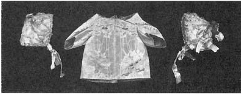
Fig. 11 b.