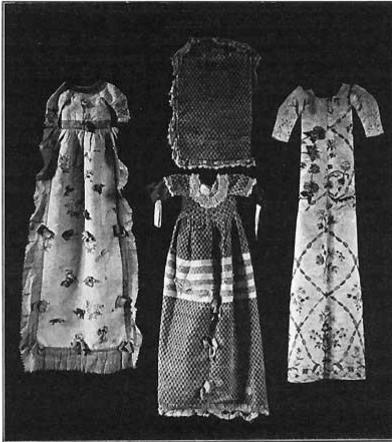
Fig. 7. a, b, c. Kristentøj (a ukendt, b fra Hammeløggen, c fra Aaby).

Fig. 7 c er af svært, elfenbensfarvet Silkedamask med Silkedamask med Silkebroderi, hvis lette, spinkle Tegning og smukke, dæmpede Farver henfører det til Louis XVI Tiden. Sømmensyningerne foroven og den meget slanke »Linie« fortæller, at der ikke har været altfor rigeligt af det smukke Stof til Raadighed. Ejendommeligt virker de helt løse Ærmer.