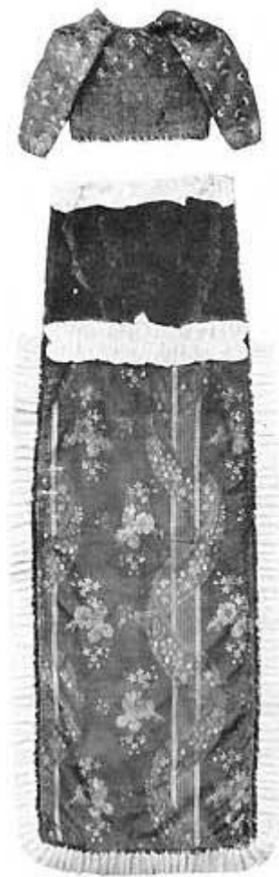
Fig. 1. Kristentøj fra Bødstrup.

Fig. 1 er et Kristentøj fra Værebros Mølle, Frederiksborg Amt. Det er syet som en Pose med hættelignende Overdel (Længde 152 cm.). De allerfleste af Museets Kristentøjer bærer mere eller mindre Spor af at være syet af brugte Stoffer, saaledes ogsaa her, hvor man har anvendt et Stykke Silketapet med Frederik den Fjerdes kronede Navnetræk. Fornemmere kunde det da ikke godt være, [ 70 | 71 ] men fornemt og festligt i hele sin rolige Komposition virker ogsaa det smukke Stof med det lyse, grønne Mønster som Relief paa en drapfarvet Bund, i Kanten et rødt, mønstret Silkebaand og en