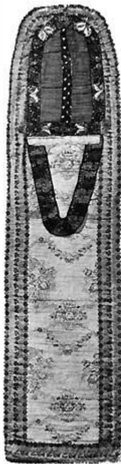
Fig. 2 Kristentøj, Hjemst. uk.

Registreringsoptegnelserne paa Clausholm efter Dronning Anna Sophies Død (1743) læser vi, at der opbevares »en Christentøjs Talar af Guldbrokade, 5¼ Alen lang, 7 Kvarter bred, underforet med Carmoisin Taft og besat med Kniplinger, en Løjert af med hvidt Taft og besat med to Puder med Kniplinger og Brokade og den anden af toile »Dansk Bondeliv« fortæller »Naar Barnet skal døbes, eller puttes i en »Kristenpose« lang Pose af »braaseret« Tøj Silkebaand paa« (Randers smal Kjole af tykt, rødt [ 70 ] er syet et Kors af af de to Striber naar fra den modsatte Fods Taaspids. hører med til (Vendsyssel). et Kristentøj i Sønder Omme som alle de andre en Pose, med et rødt Kors over Brystet,